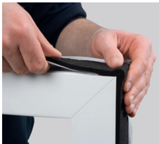
Ejemplo de instalación: ISO-BLOCO ONE

* El movimiento de elementos estructurales y los cambios de longitud temporales de las juntas deben tenerse en cuenta para dimensionar correctamente la cinta.