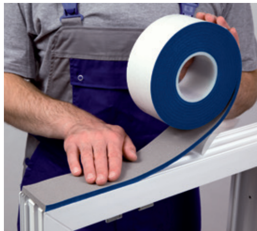
Ejemplo de instalación: ISO-BLOCO MULTI-FUNCTIONAL TAPE

* El movimiento de elementos estructurales y los cambios de longitud temporales de las juntas deben tenerse en cuenta para dimensionar correctamente la cinta.